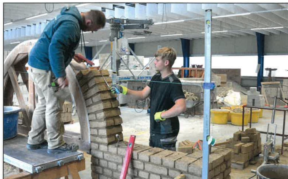
Mauern mit Lehm- steinen - Projekt- woche ökologische Bauweisen in der überbetrieblichen Ausbildung der abc Bau M-V GmbH, Rostock

Dabei lernte das gesamte Team experimentell, wie Lehm sich aus Sand, Schluff, Ton, Wasser und Luft zusammensetzt und wie die Mischungs- verhältnisse seine Eigenschaften verändern. In Gruppenarbeit fertigten sie kleine Stampflehm- wände. Dazu wurden Ökohäuser vor Ort aus Stroh, Lehm, Kalk und Recyclingmaterialien besichtigt.